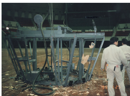
阪神大震災での大型設備機器の落下事例