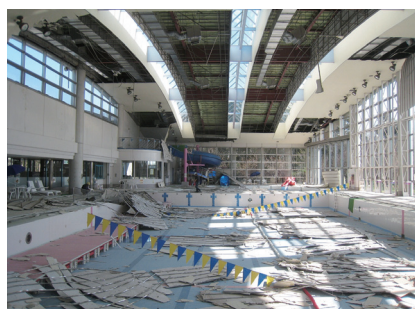
東日本大震災での天井落下事例