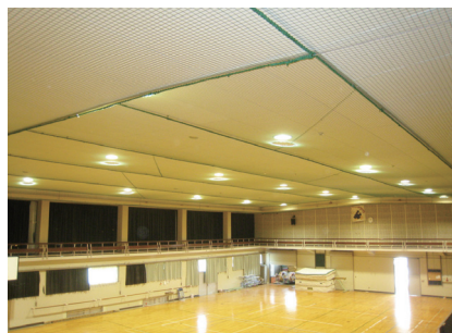
落下防止ネットの設置事例